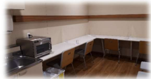
イートインコーナー