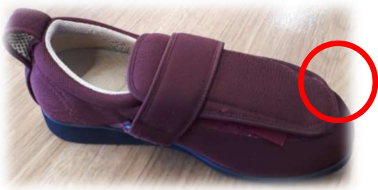
かかとのしっかりした靴