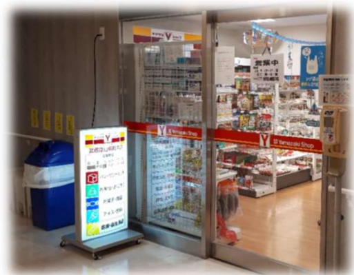
売店ヤマザキショップ