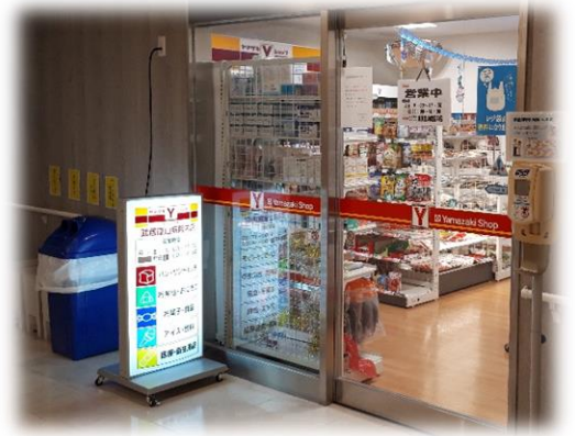
売店ヤマザキショップ