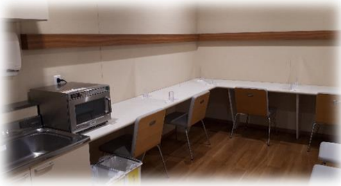
イートインコーナー