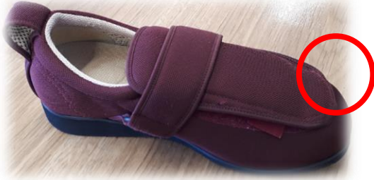
かかとのしっかりした靴